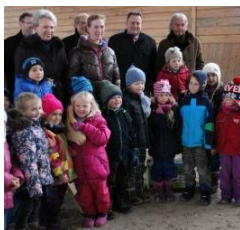
Nathalie Prinzessin zu Sayn- Wittgenstein Berleburg